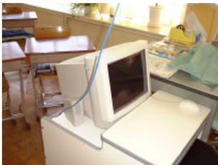
図8 各教室に配置されたコンピュータ

これにより本校では2つのネットワークが存在することになった。このうち「TV共聴システムLAN」は、コンピュータ室のコンピュータと各教室をつなぎ、『教室系ネットワーク』として児童の利用を中心としたネットワークの運用を行った。また、「手作りの校内LAN」は職員室、校長室、