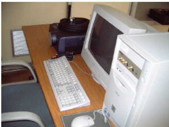
図16 TV会議用パソコン