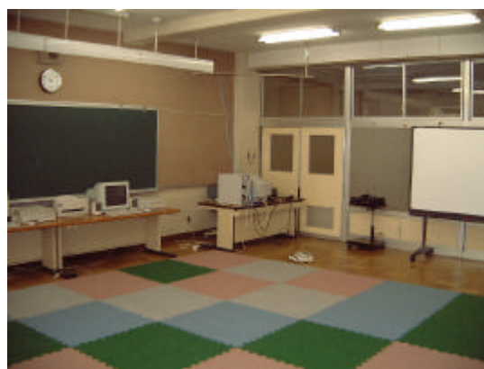
図15 学習室(調べ学習・交流学习)