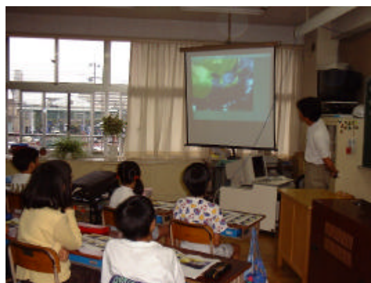
図14 インターネットで確認する

予報した天気をインターネットの定点カメラで実際に現在の天気の様子をしてみるという確かめを行った。(図14)