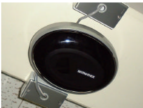
図10 赤外線無線LAN（天井側）