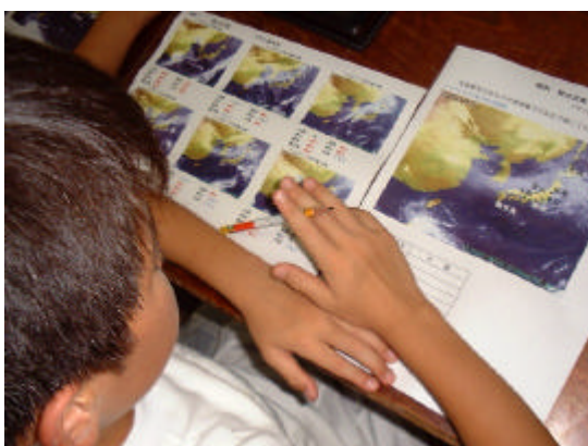
図13 ひまわりの画像の資料

この授業は、事前に図13のようなひまわりの画像を児童に資料として与え、天気予報をしてみようという試みである。