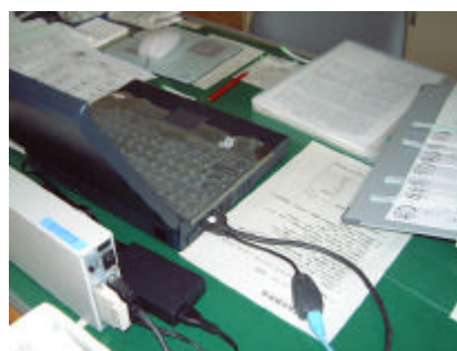
図6 職員のノートパソコン